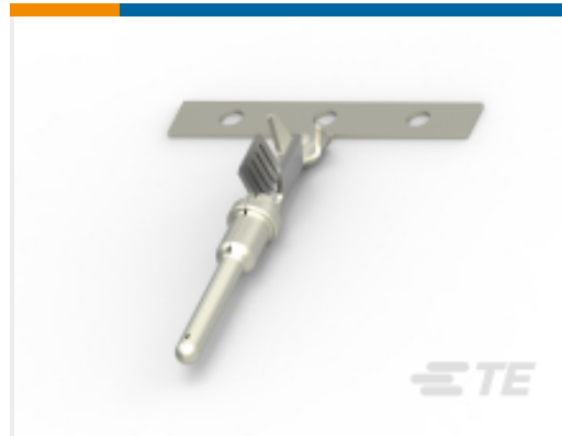
TE 产品编号2098250-3 PIN, SF, SIZE 16, 16-18 AWG, NI/SN