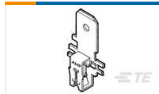
TE 产品编号63601-2 MAG-MATE 250 FAST TAB 22-20