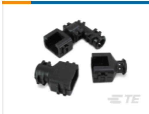
TE 产品编号2292797-1 AMPSEAL 16 连接器尾盖