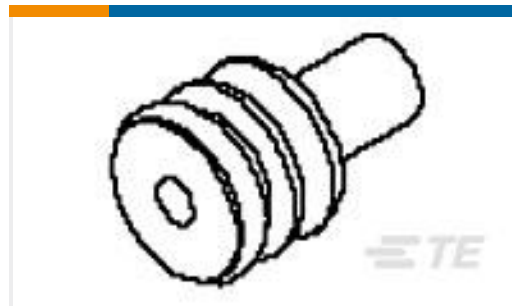
TE 产品编号638865-1 CABLE SEAL 12 AWG PWR TMR TERM