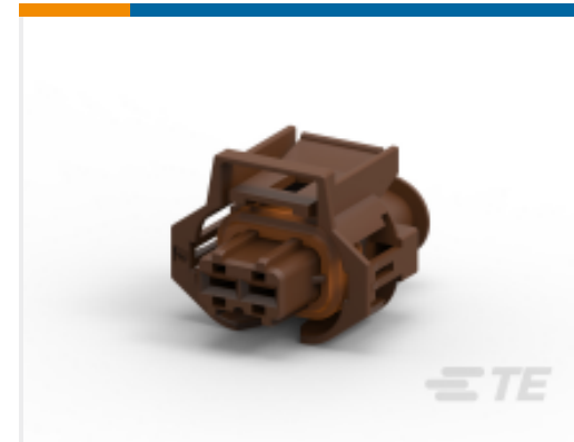
TE 产品编号2050046-3 2POS 2.8MM SENSOR PLUG ASSY