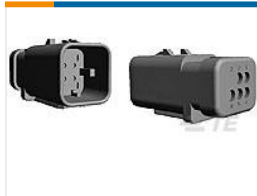
TE 产品编号776539-2 AS 16, 12P CAP ASSY, RD, KEY 2