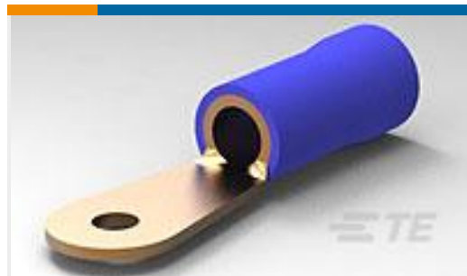
TE 产品编号52042-5 TERMINAL,R PG 6 10