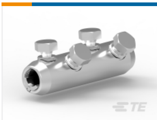
TE 产品编号 CAT-BSM 机械式接管和维修套管