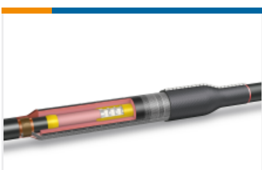
TE 产品编号CL7586-000 HVS-C-1523S