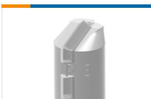
TE 产品编号A90301-000 BCAC-G-5D/8-01(B12)