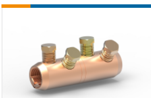
TE 产品编号1974102-1 CSBS-300-750