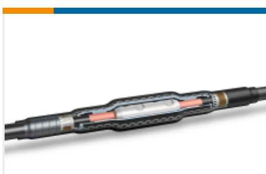
TE 产品编号CF6026-000 CSJA-1522