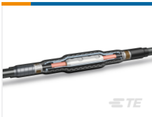
TE 产品编号CF6026-000 CSJA-1522