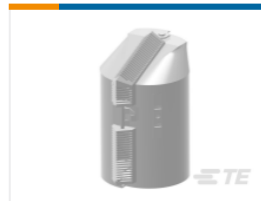
TE 产品编号A90301-000 BCAC-G-5D/8-01(B12)