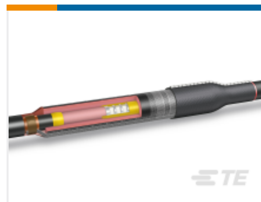
TE 产品编号CL7586-000 HVS-C-1523S