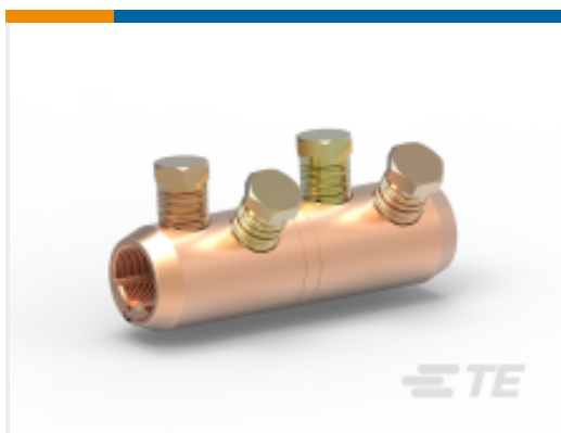
TE 产品编号1974102-1 CSBS-300-750