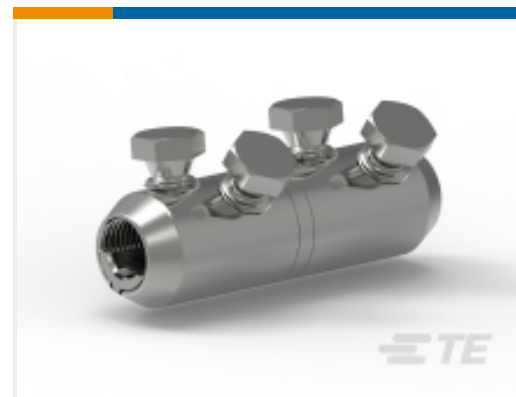
TE 产品编号1974130-1 修剪螺栓连接器高达 35 kV