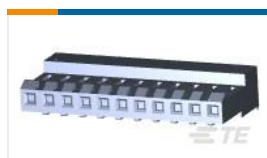
TE 产品编号4-640426-1 11P MTA156 CONN ASSY 18AWG ORA