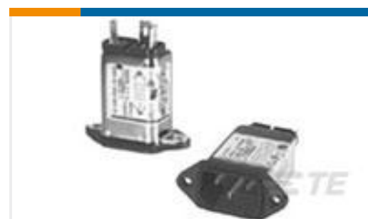
TE 产品编号6609002-3 6EAH1=F7116E S0