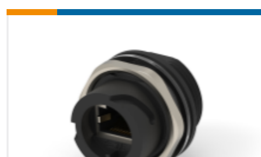
TE 产品编号2355443-2 RJ45 CAT5e PANEL MOUNT SOCKET (PBT)