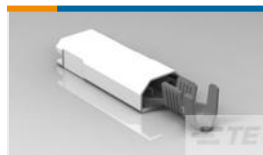
TE 产品编号520974-2 ULTRA-POD 250 ASSY REC 14-12 AWG TPBR