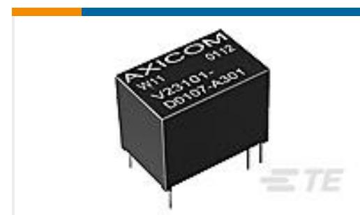
TE 产品编号1393779-5 V23101D 3A201