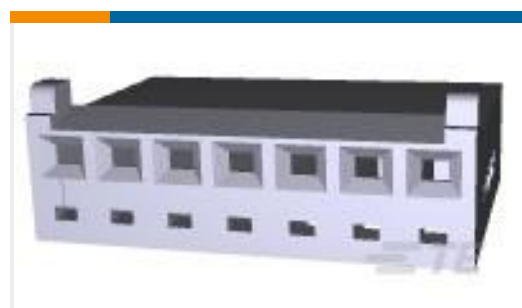
TE 产品编号1375820-7 CST-100 II HOUSING 7 POS