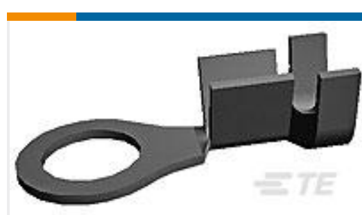
TE 产品编号41333 RING 18-14 AWG TPBR