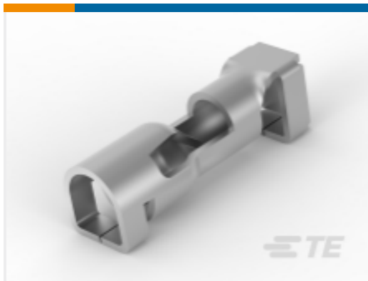
TE 产品编号2834012-3 SLIM CONTACT FOR WIRE 16-20AWG