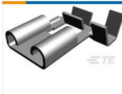
TE 产品编号62718-2 250 FASTON FLAG REC 22-18 AWG TPBR