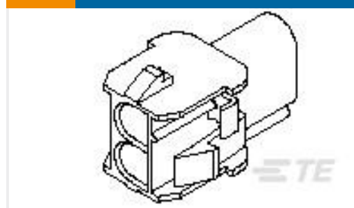
TE 产品编号794815-1 02P UMNL CAP HSG, HI TEMP