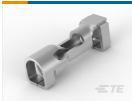
TE 产品编号2834010-3 SLIM CONTACT FOR WIRE 20-24AWG