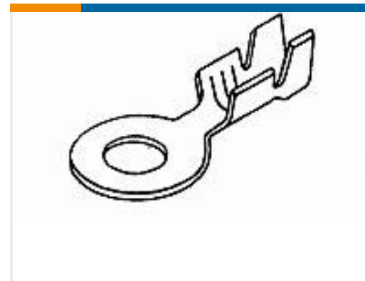
TE 产品编号42722-1 RING TONGUE 12-10 AWG BR