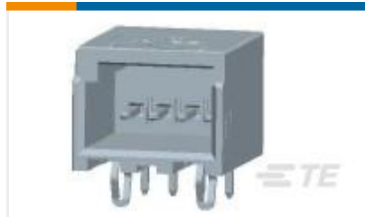
TE 产品编号1-1939760-4 HDR ASSY (H-TYPE) 4POS X-KEY Au