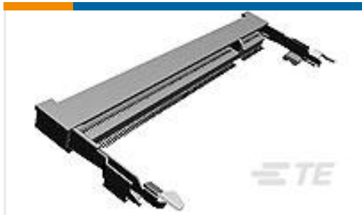
TE 产品编号1473149-4 SEMI-HARD TRAY ASSY DDR2 SODIMM 5.2H ST