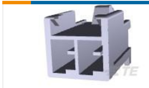
TE 产品编号179838-1 AMP POWER D/LOCK T/HDR ASSY 2P