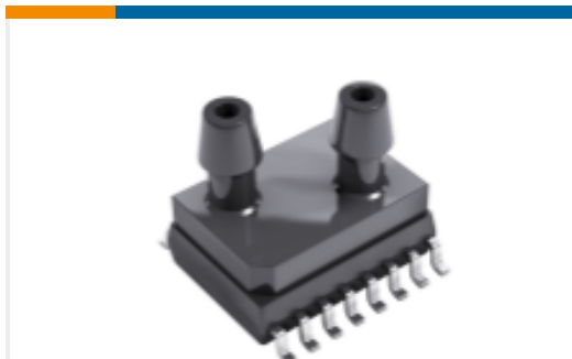
TE 产品编号9541-040C-S-C-3-T PRESSURE I2C 0.6 PSIG SO16