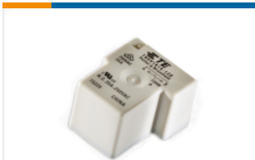
TE 产品编号2027395-3 T9SV1K15-12S