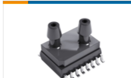
TE 产品编号7391-BCE-S-500-000 500PA DIFF. DIGITAL/ANALOG PRESSURE SENS