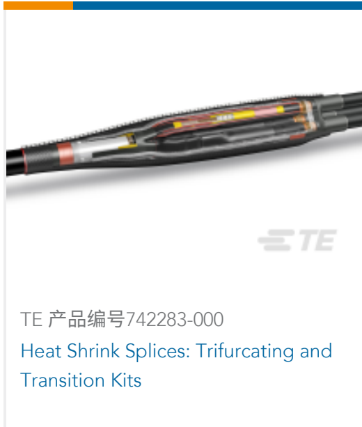
TE 产品编号742283-000 Heat Shrink Splices: Trifurcating and Transition Kits