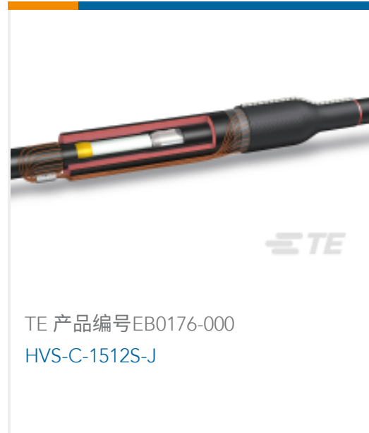
TE 产品编号EB0176-000 HVS-C-1512S-J