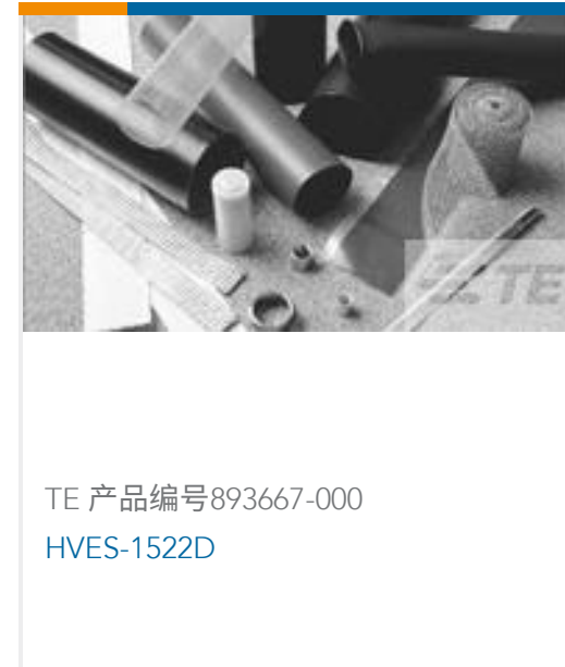
TE 产品编号893667-000 HVES-1522D