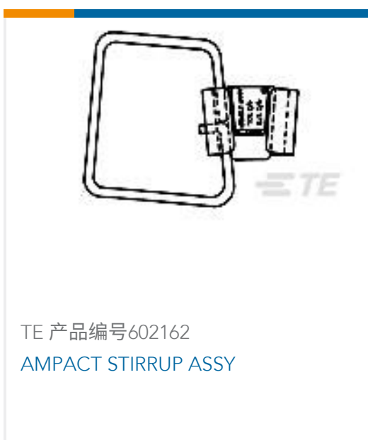
TE 产品编号602162 AMPACT STIRRUP ASSY