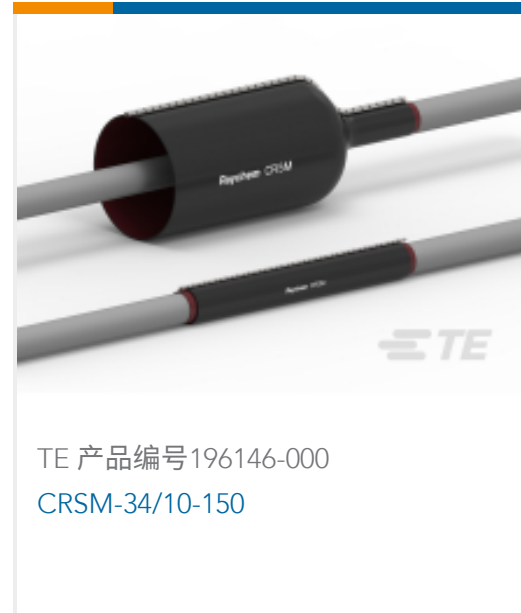
TE 产品编号196146-000 CRSM-34/10-150