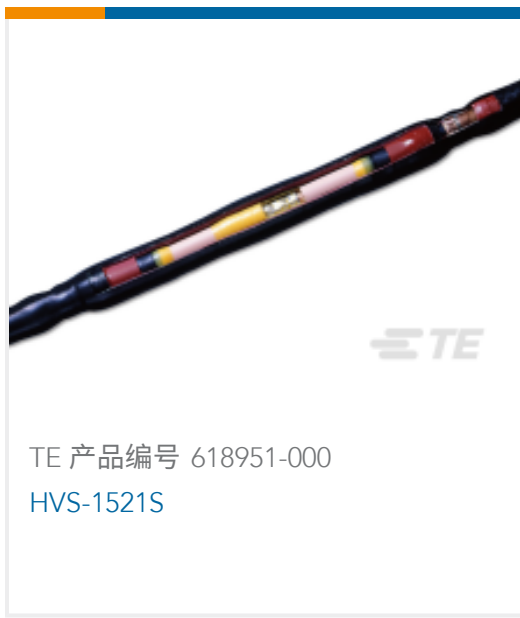
TE 产品编号 618951-000 HVS-1521S