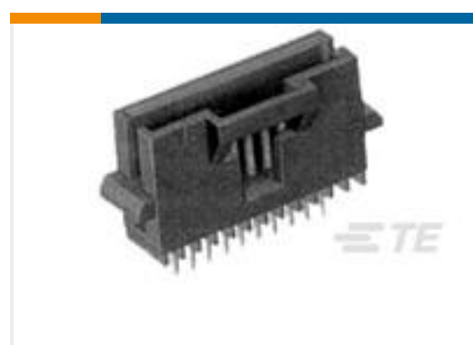
TE 产品编号5-104804-2 15 SYSTEM 50 HDR SRST SHRD SN