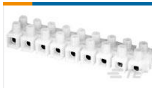
TE 产品编号1-1986469-2 TSB2000K12DSHT=EUROPA BL,14.5M