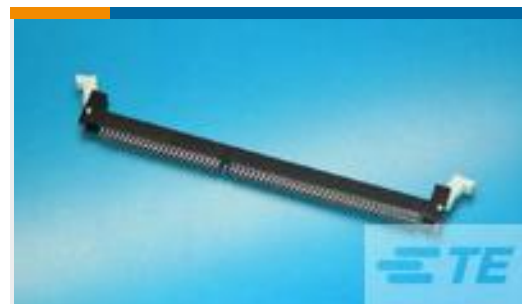
TE 产品编号1-1932031-2 VERTICAL DDR3 DIMM, 240 POSITION, LR