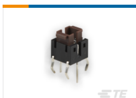
TE 产品编号5-2213818-1 6X6 ILL TACT THT 520GF LI YELLOW GREEN