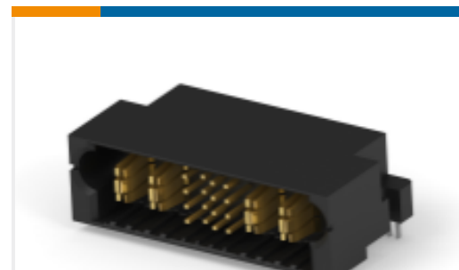
TE 产品编号1-2204910-0 MBXL R/A HDR 2P + 16S + 2P