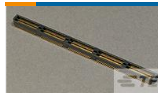
TE 产品编号1658013-5 MSB0.80PL5ASY200FL,-,10,-TY