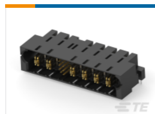
TE 产品编号5-6450840-4 MBXLE R/A HEADER 2ACP + 8S + 4ACP