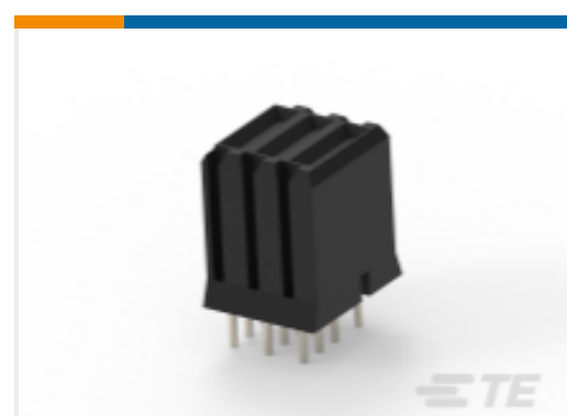
TE 产品编号5-5223955-5 UPM VER REC POWER, HI CURRENT