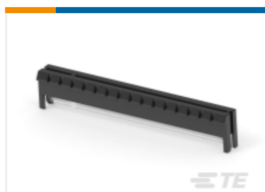
TE 产品编号2041313-4 PCI-E, Straddle, 164P, 30u", P