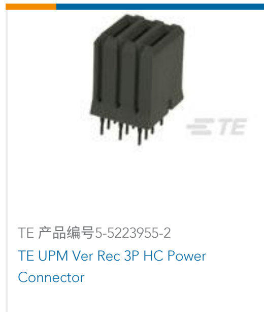
TE 产品编号5-5223955-2 TE UPM Ver Rec 3P HC Power Connector