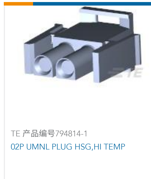
TE 产品编号794814-1 02P UMNL PLUG HSG, HI TEMP