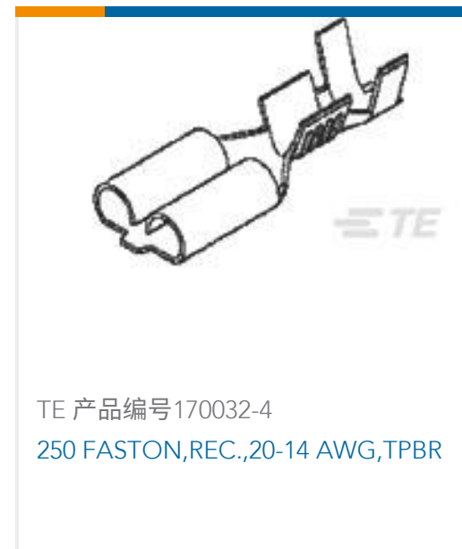
TE 产品编号170032-4 250 FASTON, REC., 20-14 AWG, TPBR