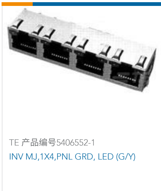
TE 产品编号5406552-1 INV MJ,1X4,PNL GRD, LED (G/Y)