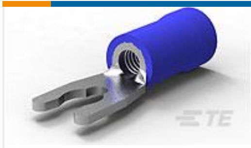
TE 产品编号52955-3 TERMINAL,PG SPR SPD 16-14 6