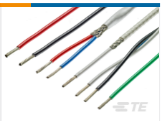
TE 产品编号2823013001 44A0211-8-9