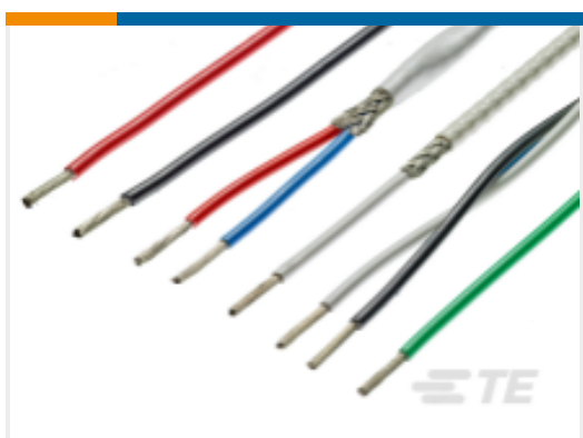
TE 产品编号2611473001 44A0111-12-54