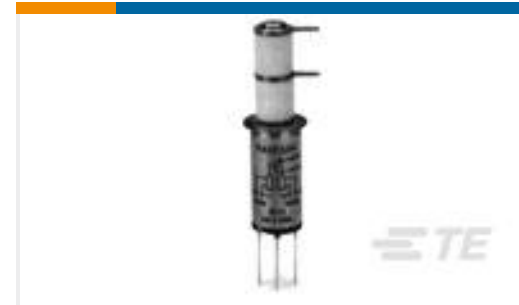
TE 产品编号4-1618240-0 K43P334=RELAY, VAC SPST LATCHI