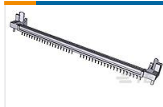
TE 产品编号5822138-4 80 ME .050 L/P AU M/L PB-FREE