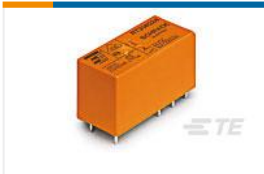
TE 产品编号2-1393243-4 RTE25524