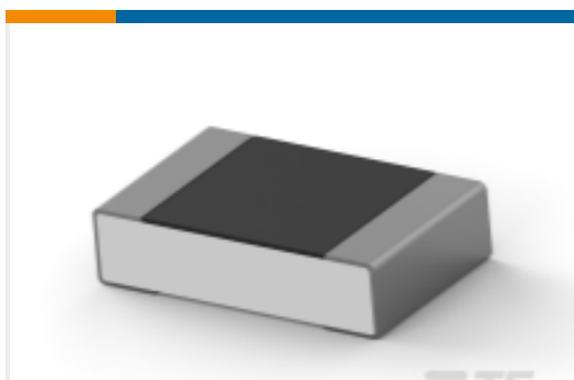
TE 产品编号9-2176374-8 RQ 0805 1K1 0.1% 10PPM 1K RL