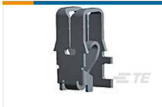
TE 产品编号964339-1 MAG MATE KONT. MKII