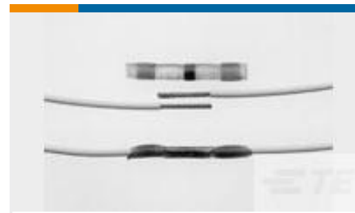
TE 产品编号F80600-000 B-152-9004