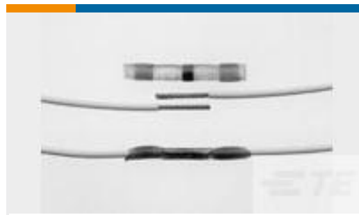
TE 产品编号D33598-000 B-152-9003