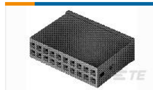
TE 产品编号87133-2 10 LOCKING CLIP HSG DR .100CL