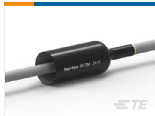
TE 产品编号CH5647-000 WCSM-24/6-600/S(S20)