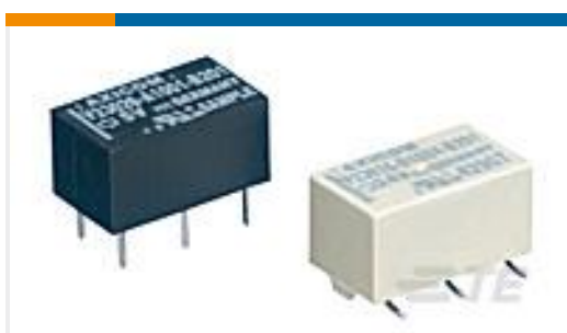
TE 产品编号1-1393774-2 V23026A1004B201