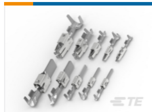
TE 产品编号927771-6 定时器，母端和公端