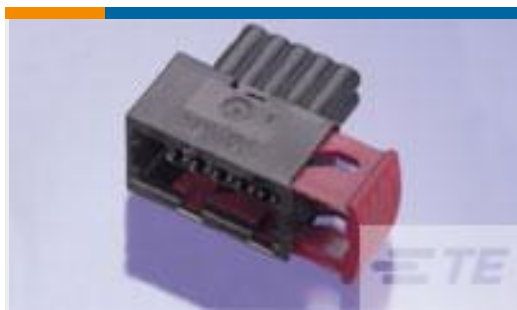
TE 产品编号1-963212-1 6P J-P-T GEH KOMPL