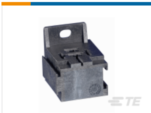
TE 产品编号1-1904045-2 V23333Z1001A008-EV-100