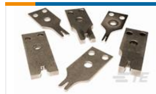
TE 产品编号2-456134-2 CRIMPER, INSULATION "F"(.110")