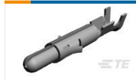
TE 产品编号350561-1 UMNL PIN 24-18 .0126 PTPBR