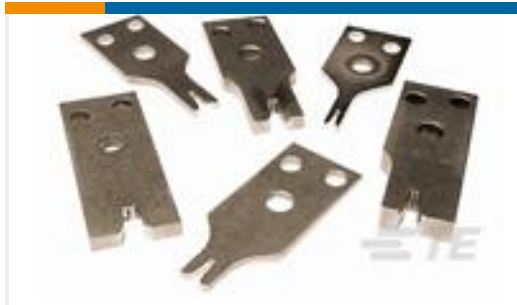
TE 产品编号3-456404-2 CRIMPER, WIRE .070 F