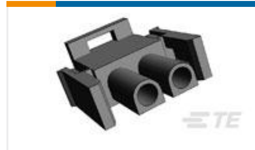
TE 产品编号1-480698-0 02P UMNL PLUG HSG NATL