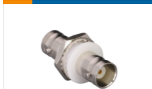
TE 产品编号ADP-BNCF-BNCF-B BNC Jack to BNC Jack Bulkhead