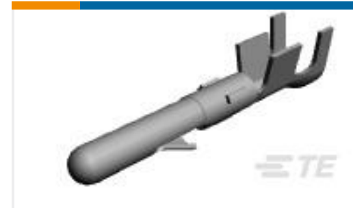
TE 产品编号60618-6 CMNL PIN AUPHBZ L/P