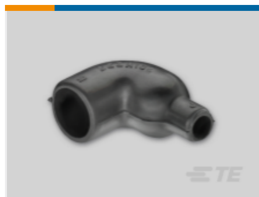
TE 产品编号806823-000 球形热缩护套: 有嘴, 直角