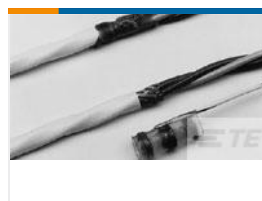
TE 产品编号C88166-000 S200-1-W1-22-9