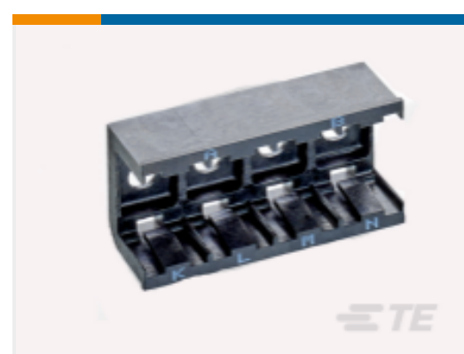
TE 产品编号DCR-1A-06 COMPOSIT RAIL