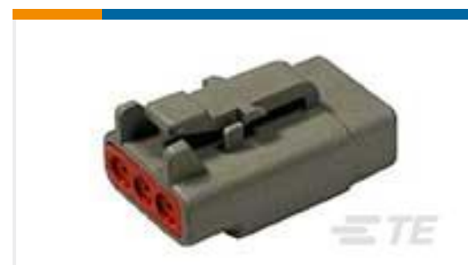
TE 产品编号DTM06-3S PLG, 3P, GRY, N