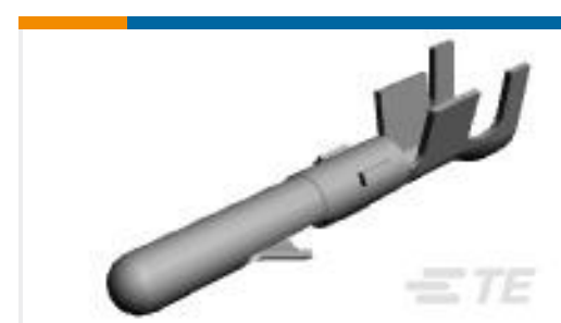
TE 产品编号60618-1 CMNL PIN PTPBR L/P