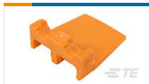
TE 产品编号WP-2P WEDGE LOCK, 2P, REC, ORG, DTP