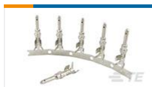
TE 产品编号1060-12-0222 PIN, SF, SIZE 12, 10, NI/NI