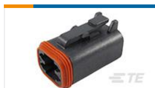
TE 产品编号DT06-4S-P012 PLG, 4P, BLK, N, SEAL RET