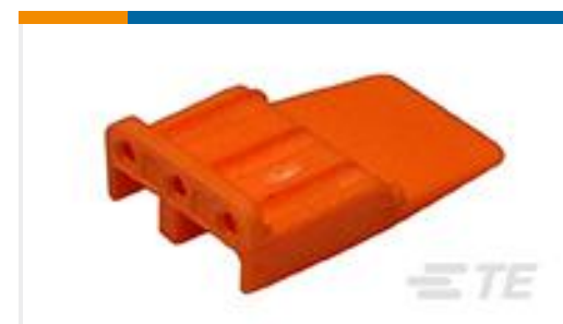
TE 产品编号WM-3S WEDGE LOCK, 3P, PLG, ORG, DTM