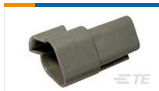
TE 产品编号DT04-3P REC, 3P, GRY, N