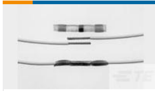
TE 产品编号D33598-000 B-152-9003