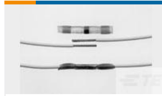
TE 产品编号F80600-000 B-152-9004