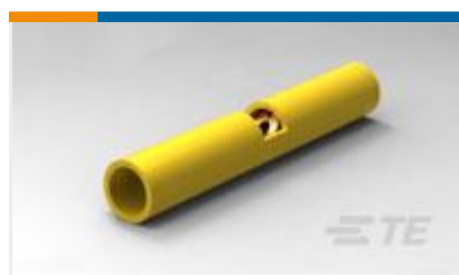
TE 产品编号2-323994-1 PIDG BUTT SPLC WDW 26-22; TAPE