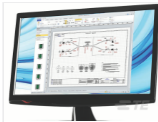
TE 产品编号 9-120035-6 HarnWare/HarnVis Renewal Charge