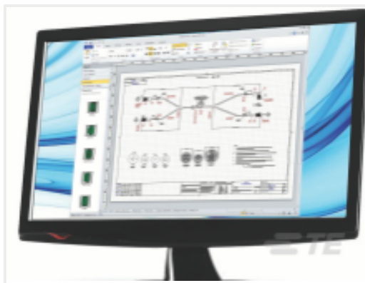
TE 产品编号 9-120035-5 HarnWare/HarnVis Purchase Charge