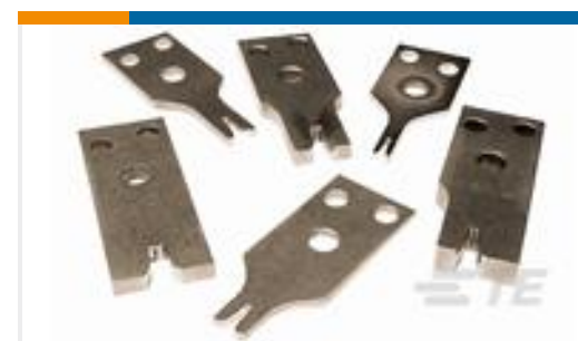
TE 产品编号5-1707070-1 WIRE CRIMPER