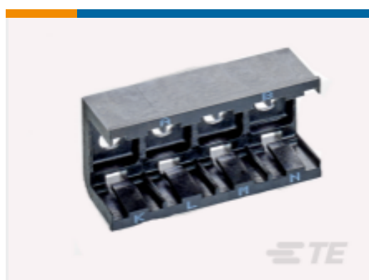
TE 产品编号DCR-1A-06 COMPOSIT RAIL