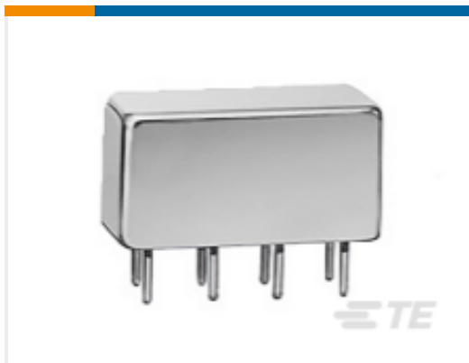
TE 产品编号3-1617029-7 HFW1131K05P = M39016/6-207P