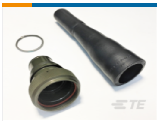
TE 产品编号808529S004 202D242-4-114-CS2542