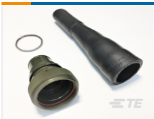
TE 产品编号808536S003 202D263-4-122-CS2542