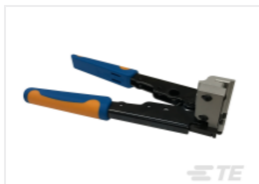
TE 产品编号 2305570-1 Strip Terminal Cutter-Side Feed-No Crimp