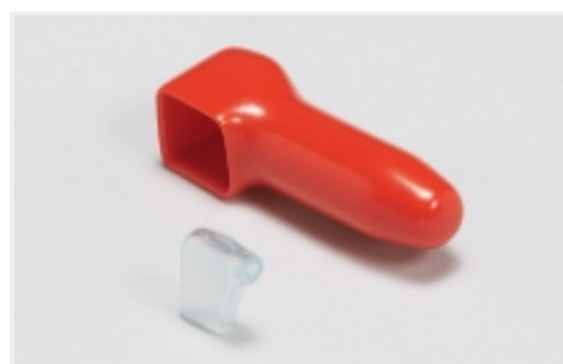
绝缘防护罩和套管(1)