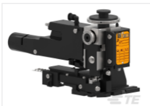
TE 产品编号 2266747-2 OCEAN-2.0-APPLICATOR-S-090F140F-RSA