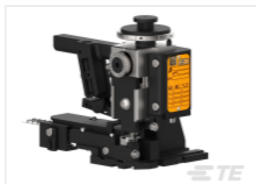
TE 产品编号 2266747-1 OCEAN-2.0-APPLICATOR-S-090F140F-RSM