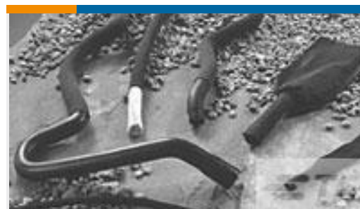
TE 产品编号CH16626001 HFT5000-30/15-0-510MM