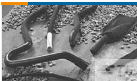
TE 产品编号CH14126001 HFT5000-60/30-0-210MM