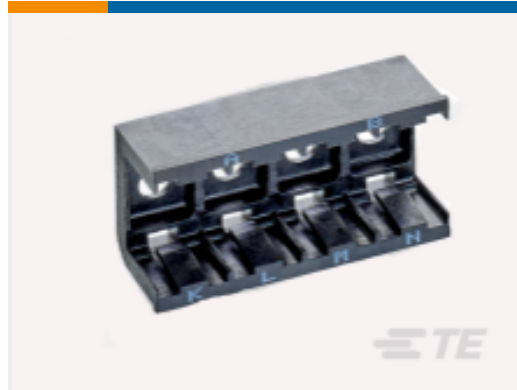
TE 产品编号DCR-1A-06 COMPOSIT RAIL