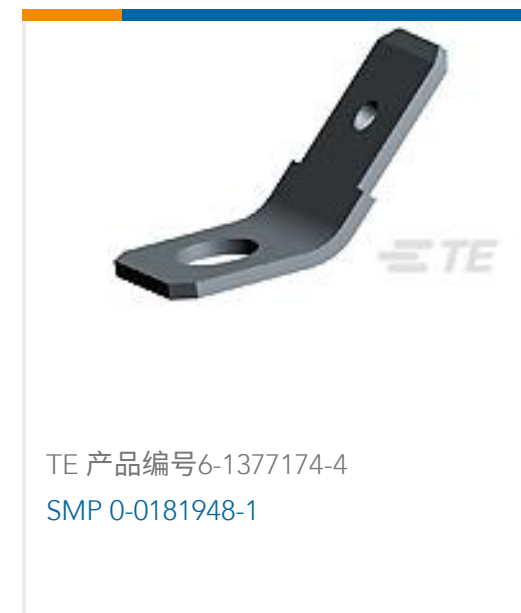
TE 产品编号6-1377174-4 SMP 0-0181948-1