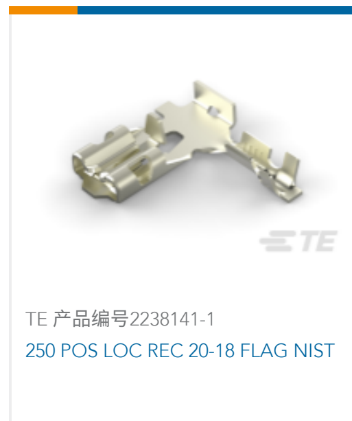
TE 产品编号2238141-1 250 POS LOC REC 20-18 FLAG NIST