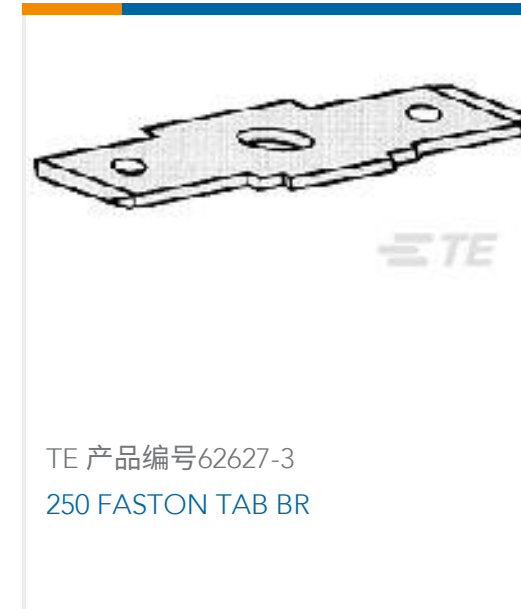
TE 产品编号62627-3 250 FASTON TAB BR