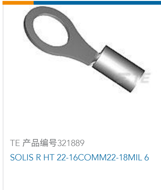
TE 产品编号321889 SOLIS R HT 22-16COMM22-18MIL 6