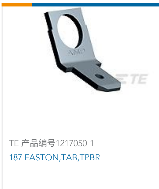
TE 产品编号1217050-1 187 FASTON,TAB,TPBR