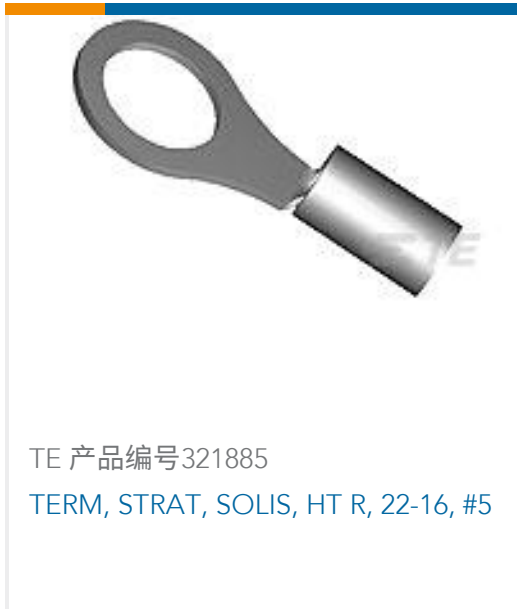
TE 产品编号321885 TERM, STRAT, SOLIS, HT R, 22-16, #5