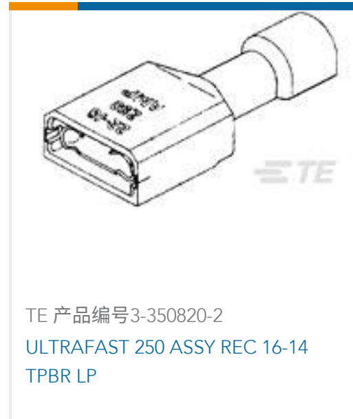
TE 产品编号3-350820-2 ULTRAFast 250 ASSY REC 16-14 TPBR LP