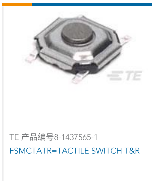
TE 产品编号8-1437565-1 FSMCTATR=TACTILE SWITCH T&R