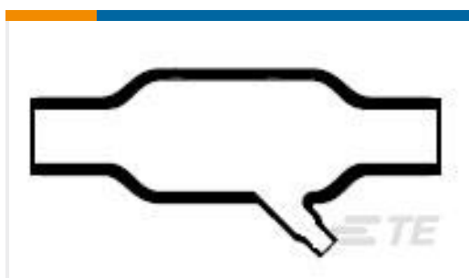
TE 产品编号413669-000 342A034-25/225-0