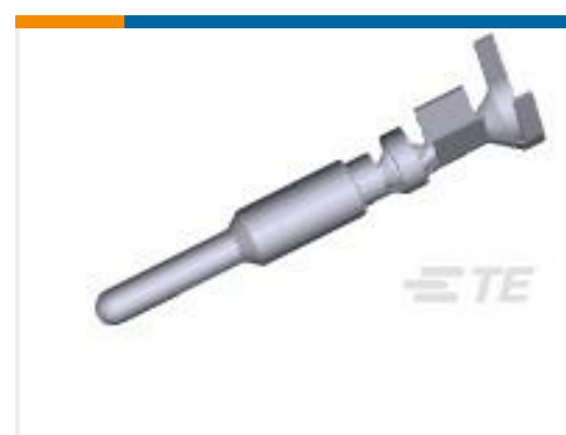
TE 产品编号1-770194-0 UMNLII GRND PIN DUPL AUBR LF