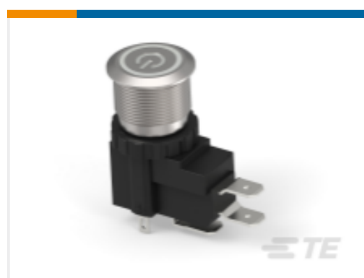
TE 产品编号2-2364573-0 AVH19 FLT SS LK R+P BLU 24V26A