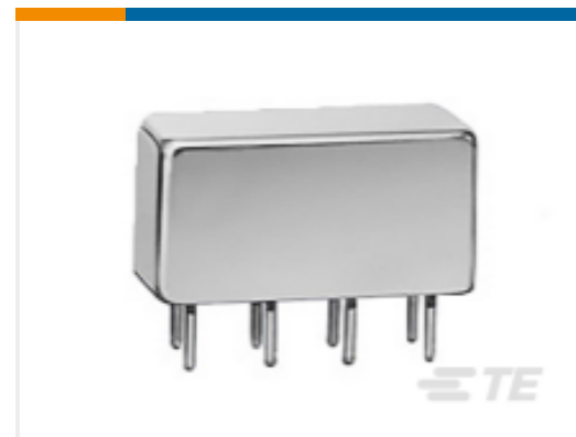
TE 产品编号1-1617038-1 HMB1131G01M = M39016/22-014M