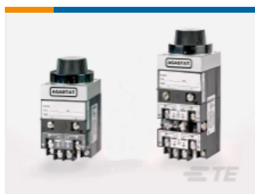
TE 产品编号7-1755074-3 7012AEMX=RLY,STD,ON,2P,120V, 200S,M,X