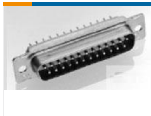
TE 产品编号205487-2 AMPLIMITE,ASY,PLUG,FB,109,3,CONT