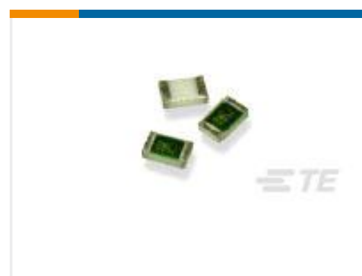
TE 产品编号3-1614882-7 CPF0603 604R 0.5% 25PPM 5K RL