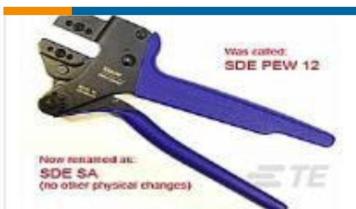
TE 产品编号2063490-1 SDE TAB 0.5-2.5mm2 ASSY