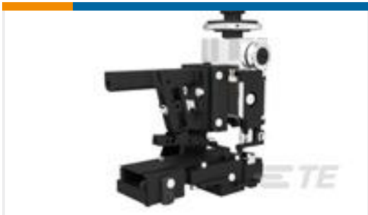
TE 产品编号2266101-1 OCEAN_2.0_APPLICATOR-S-090F110O-RSM