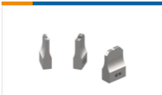
ANVIL REPRESENTATION ONLY