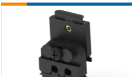
TE 产品编号2389168-2 SDE F DEUTSCH (12) 2.0-2.5mm2 DIE SET