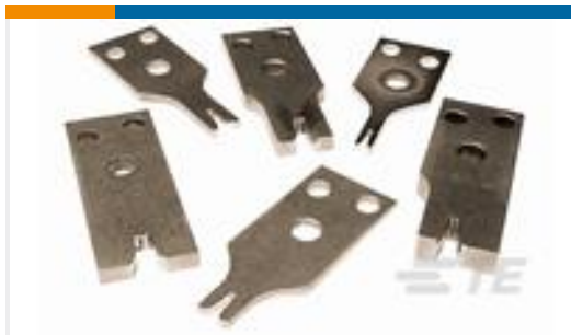
TE 产品编号1803019-8 CRIMPER, INSULATION O