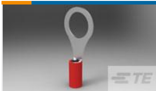
TE 产品编号31895 PIDG R 22-16COMM 22-18MIL 5/16