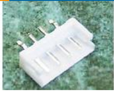
TE 产品编号1775284-3 HPI, 2.5MM, EMIX, A'SSY, V/T, 3P, IVORY