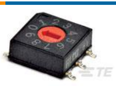
TE 产品编号1825013-6 MRD10CSTR04=7MM ROT DIP, BCD COMP