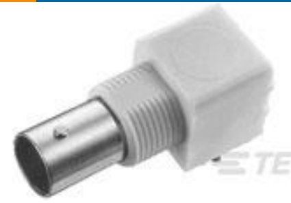
TE 产品编号5415633-1 RTANG BNC PCB JACK - 75 OHM