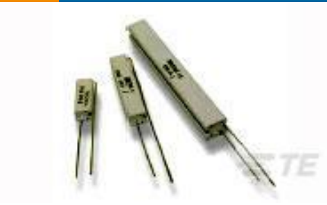
TE 产品编号1623722-4 SBCH 11 33R 5%