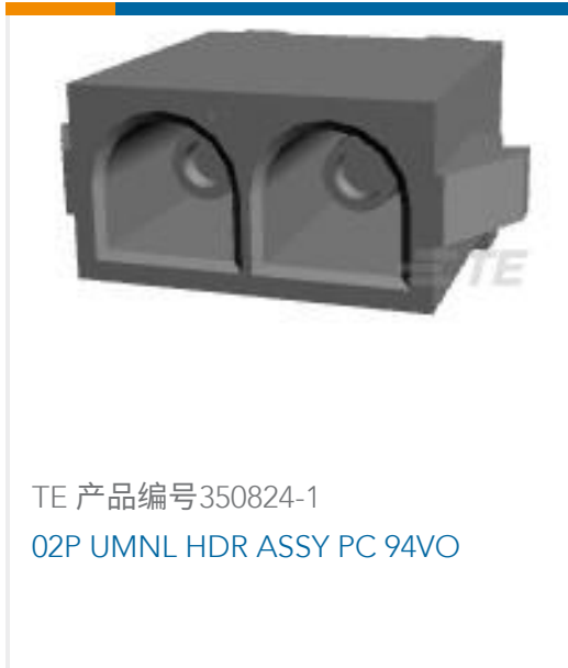
TE 产品编号350824-1 02P UMNHL HDR ASSY PC 94VO