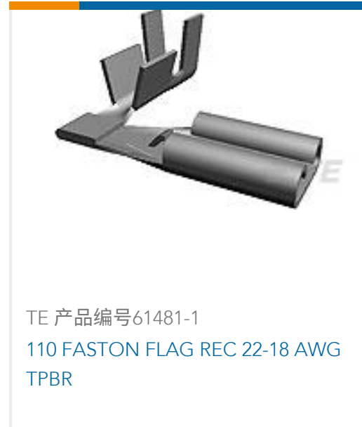
TE 产品编号61481-1 110 FASTON FLAG REC 22-18 AWG TPBR