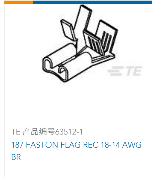
TE 产品编号63512-1 187 FASTON FLAG REC 18-14 AWG BR