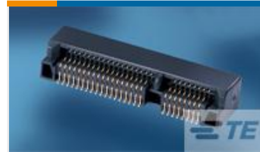
TE 产品编号2041119-1 mSATA/mini PCI-E 4H Type I G/F