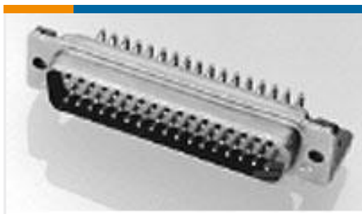
TE 产品编号1757836-5 AMPLIMITE,R/A RCPT ASY,109,ZN,5