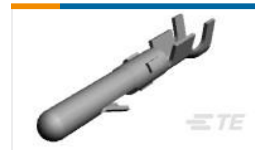
TE 产品编号61116-2 CMNL PIN 24-18 BR