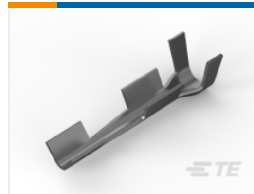
TE 产品编号 62419-1 SPLICE 1600-4100 .020 TPBR