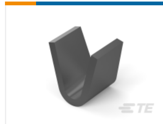
TE 产品编号 61008-1 SPLICE 18-16 AWG .0158 TPST