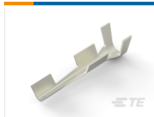
TE 产品编号 62419-3 SPLICE 18-16/18-14 AWG .020 NPST