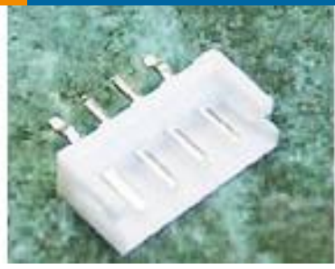
TE 产品编号1775284-3 HPI, 2.5MM, EMIX, A'SSY, V/T, 3P, IVORY