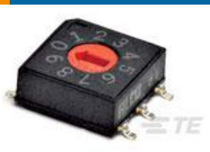
TE 产品编号1825013-6 MRD10CSTR04=7MM ROT DIP, BCD COMP