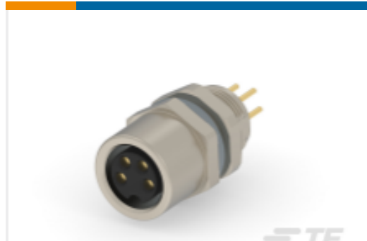
TE 产品编号T4043014041-000 M8.FMLE.PNLFRONT.4POS.STRPCB