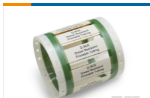
TE 产品编号EC1920-000 D-SCE Fluid Resistant Sleeves