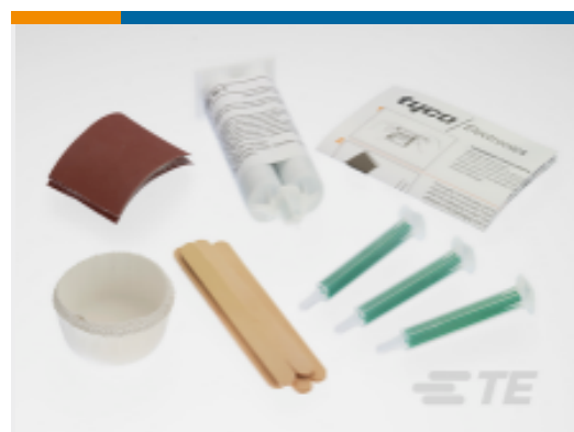
TE 产品编号 657863-000 S1125-KIT-8