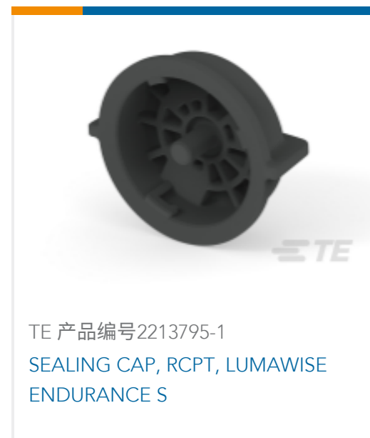
TE 产品编号2213795-1 SEALING CAP, RCPT, LUMAWISE ENDURANCE S