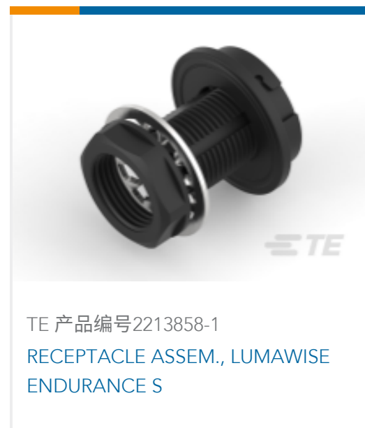
TE 产品编号2213858-1 RECEPTACLE ASSEM., LUMAWISE ENDURANCE S