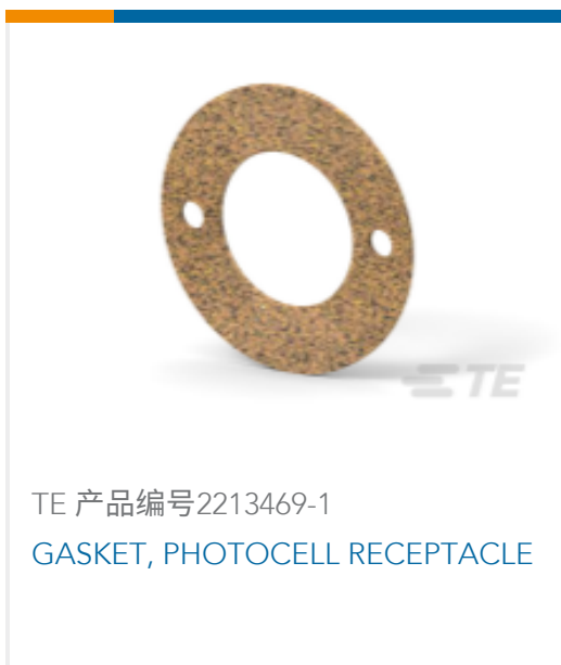
TE 产品编号2213469-1 GASKET, PHOTOCELL RECEPTACLE