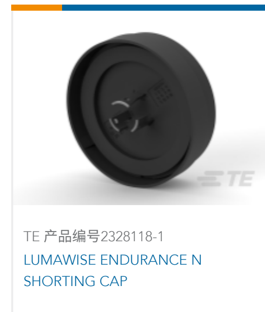
TE 产品编号2328118-1 LUMAWISE ENDURANCE N SHORTING CAP