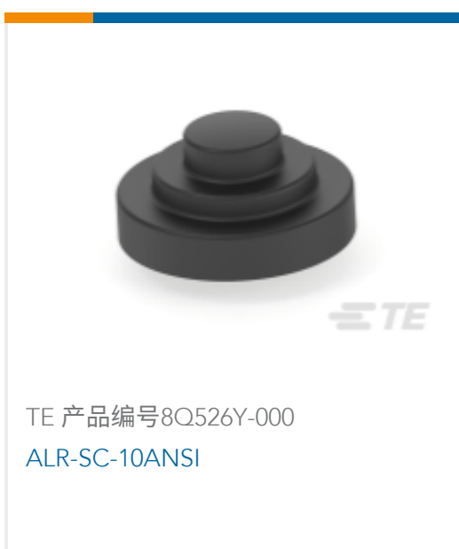
TE 产品编号8Q526Y-000 ALR-SC-10ANSI