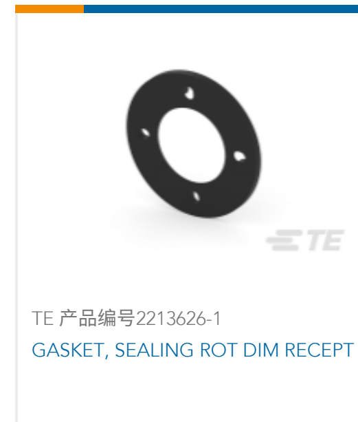
TE 产品编号2213626-1 GASKET, SEALING ROT DIM RECEPT