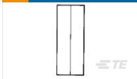
TE 产品编号34130-4 SOLIS, PARA 22-16 60/40 SN-PB