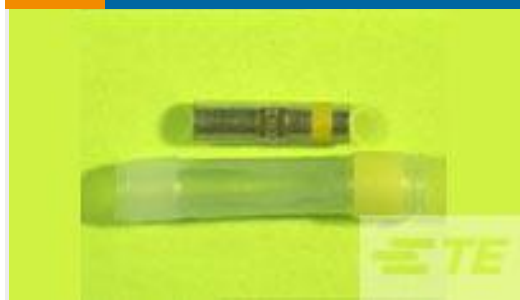
TE 产品编号650127-000 D-436-83