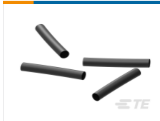
TE 产品编号NB17842001 RW-175-1-1/2-0-STK