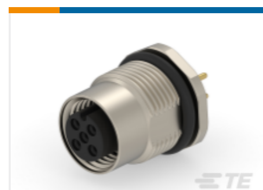
TE 产品编号T4141042041-000 M12,REAR MOUNTING,FEMALE,A CODE,4P