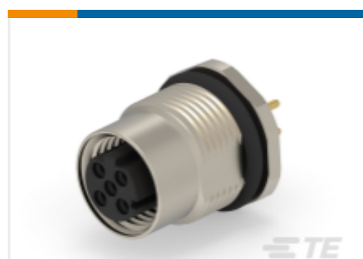
TE 产品编号T4141542041-000 M12,REAR MOUNTING,FEMALE,D CODE,4P