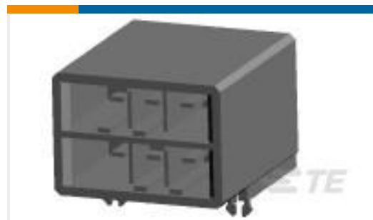
TE 产品编号3-178139-5 DYNAMIC 3200 HDR H 6P ASSY