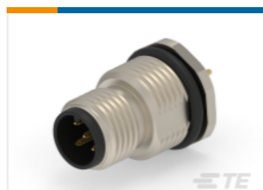
TE 产品编号T4140042051-000 M12,REAR MOUNT,MALE,A,5P, SOLDER PCB