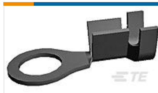
TE 产品编号60320-2 AMPLIVAR RG 18-14 #8 TPBR