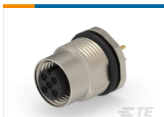
TE 产品编号T4141042051-000 M12,REAR MOUNTING,FEMALE,A CODE,5P