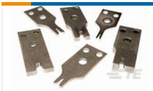
TE 产品编号3-456402-0 CRIMPER, WIRE .055" F