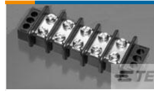
TE 产品编号1546307-2 2P .374" DR BARRIER,W/WASHER