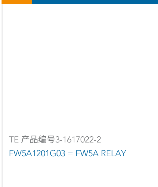
TE 产品编号3-1617022-2 FW5A1201G03 = FW5A RELAY