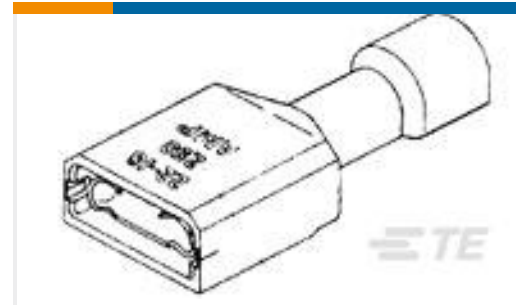
TE 产品编号2-520405-2 ULTRA-FAST 250 ASY REC 22-18 TPBR