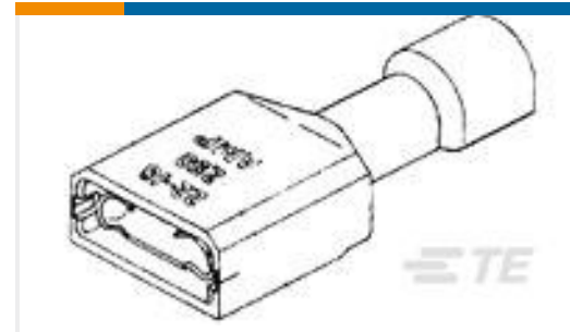
TE 产品编号3-520406-2 ULTRA-FAST 250 ASY REC 16-14 AWG TPBR