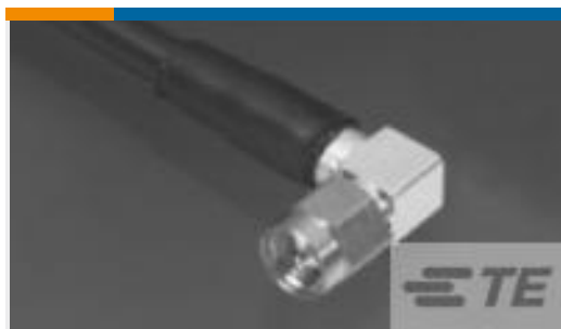
TE 产品编号 1052203-1 2037 8126 92