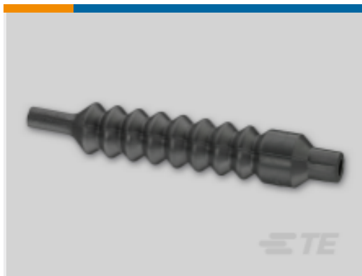
TE 产品编号 F67100-000 202C653-770-0