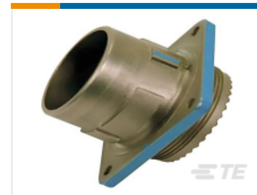
TE 产品编号 YDIV46E25-61SNC128 PLUG ASSY