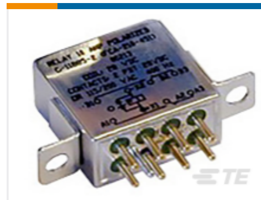
TE 产品编号 1-1617749-5 FCA-210-1020M=M83536/10-020M