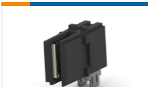
TE 产品编号2178410-1 CROWN CLIP JUNIOR CONN