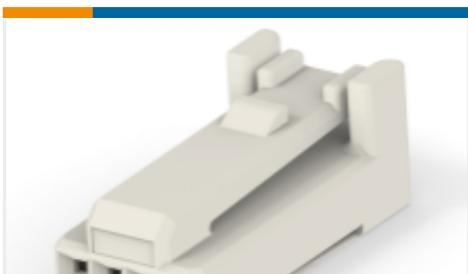
TE 产品编号1318620-3 025 ANCHOR HEIGHT SENSOR 4POS PLUG HSG