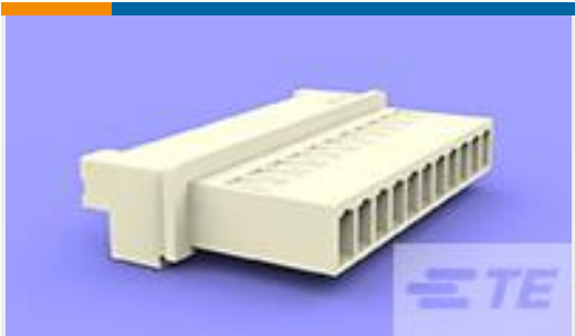
TE 产品编号1969588-2 HSG, REC, FREE-HANGING, SINGLE ROW,EP2.5