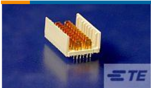
TE 产品编号6469076-1 HM-ZD 2PR HDR ASSY 1.8MM