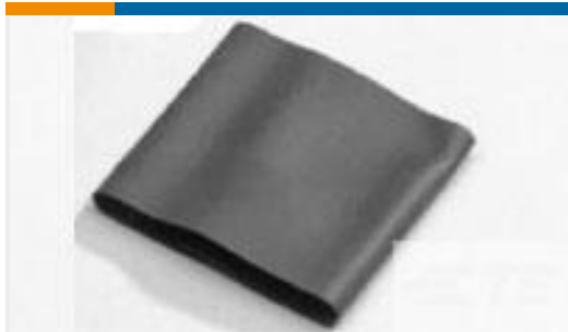
TE 产品编号592387J001 V2-4.0-0-SP-SM