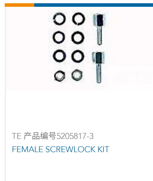
TE 产品编号5205817-3 FEMALE SCREWLOCK KIT