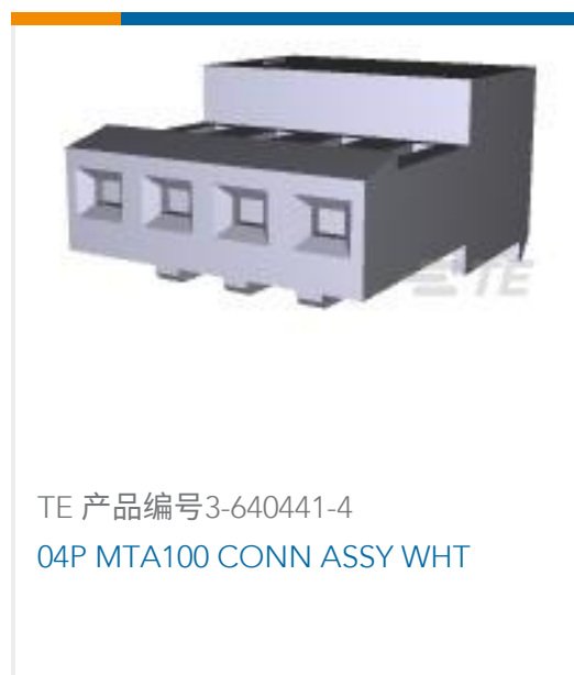
TE 产品编号3-640441-4 04P MTA100 CONN ASSY WHT