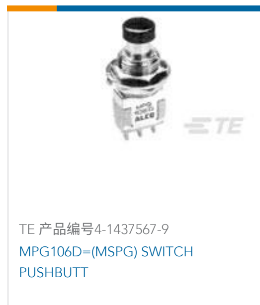
TE 产品编号4-1437567-9 MPG106D=(MSPG) SWITCH PUSHBUTT