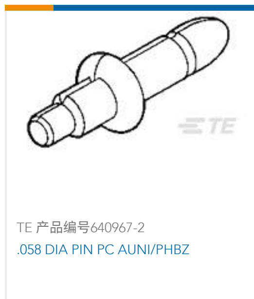
TE 产品编号640967-2 .058 DIA PIN PC AUNI/PHBZ