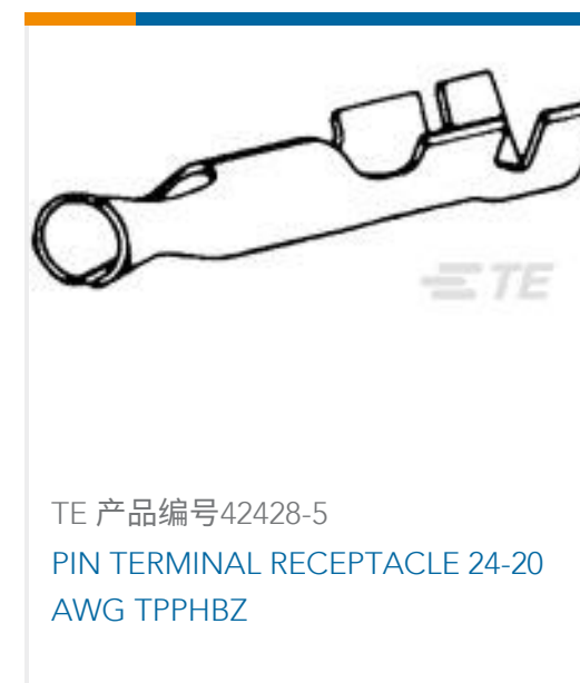
TE 产品编号42428-5 PIN TERMINAL RECEPTACLE 24-20 AWG TPPHBZ