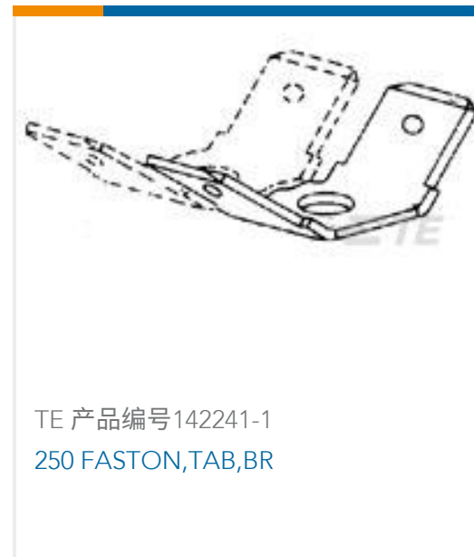
TE 产品编号142241-1 250 FASTON, TAB, BR