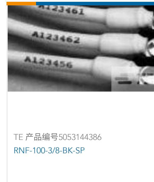
TE 产品编号5053144386 RNF-100-3/8-BK-SP