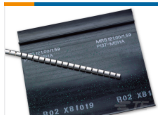
TE 产品编号 738571-000 MRSM-100/51-750/239(S5)