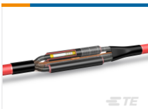
TE 产品编号EK9467-000 EPKJ-SY270