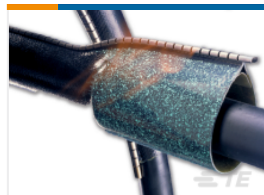
TE 产品编号 EE9068-000 CNSM-100/25-500/AC(S5)