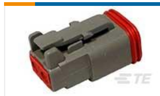
TE 产品编号DT06-2S PLG, 2P, GRY, N